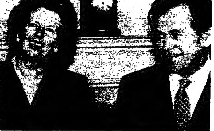
هافل أثناء محادثته مع القذافي

قال الرئيس التشيكوسلوفاكي فلادلاف هافل في لندن أمس ان حكومتها تشيكوسلوفاكية الشيوعيين السابقين، صبروا كحيات من متفجرات تكفي لتزويد الارهابيين في ليبيا، ١٥٠ عاماً. وذكر الرئيس هافل، في مؤتمر صحفي، في ذاتي ليام زيارته لبريطانيا، وقد توقتنا عن تصديره لمتفجرات منذ بعض الوقت، ولكن للظلم لسنوات من ٢٠٠٠ طن الى ليبيا، و٢٠٠٠ غرام تكفي لنسف طائرة، ولدى الازمات اللعالي كصيات من، السيمبكتس، تكفي ١٥٠ عاماً.